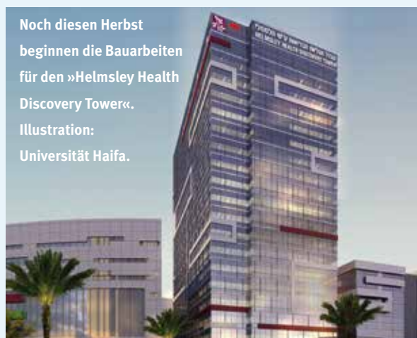
Noch diesen Herbst beginnen die Bauarbeiten für den »Helmsley Health Discovery Tower«. Illustration: Universität Haifa.