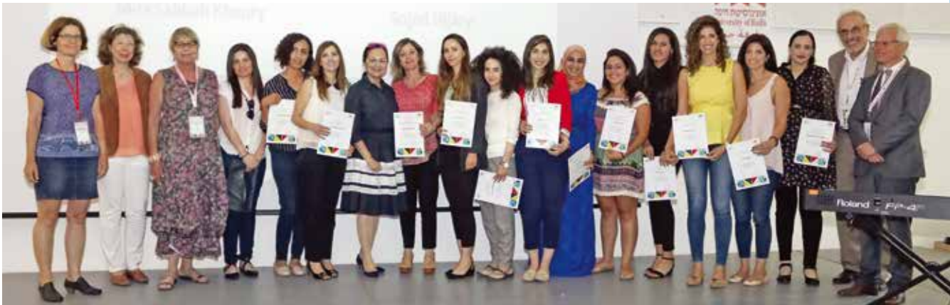
▲ Auf dem Deutschen Empfang verlieh der Deutsche Fördererkreis Stipendien an 13 herausragende arabische Studentinnen.