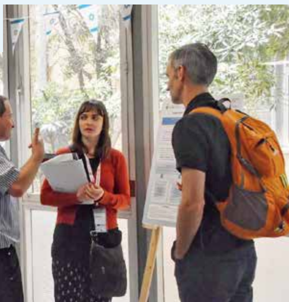
Internationale DoktorandInnen und MasterstudentInnen stellten ihre Forschungsprojekte zum Thema »Parallelgesellschaften« in einer Postersession zur Diskussion.