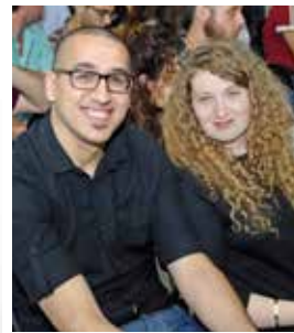
◀ StipendiatInnen beim Deutschen Empfang.